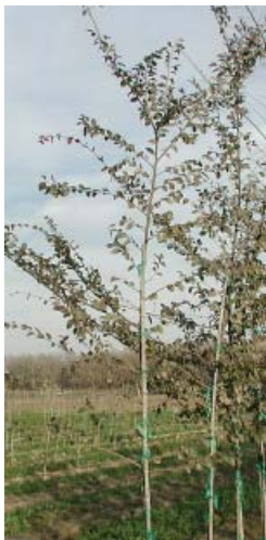
Tree before pruning. El Árbol antes de podar.

Los cortes exteriores se deben hacer cerca de los ojos de brote frente para promover el crecimiento nuevo exterior para formar una mejor cabeza.